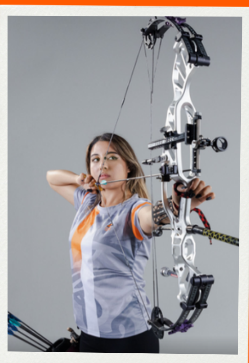
Tiro al blanco