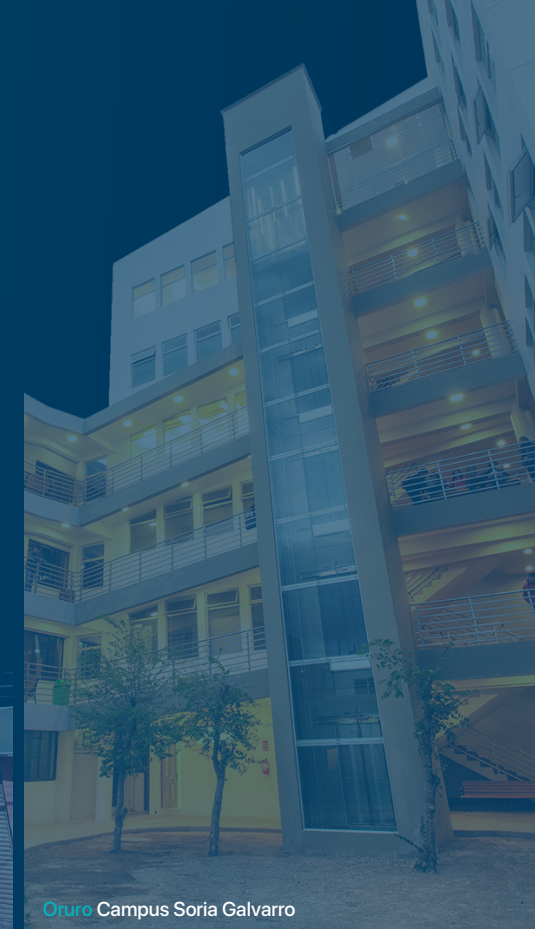
Oruro Campus Soria Galvarro