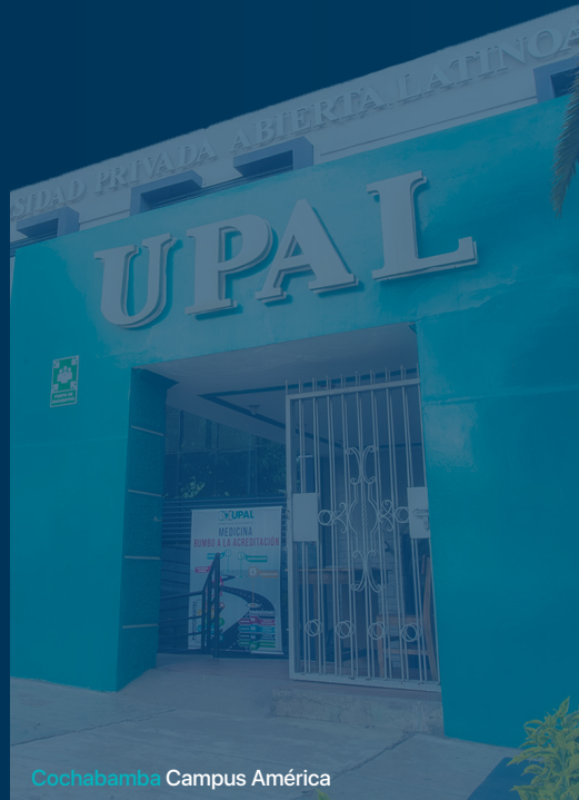
Cochabamba Campus América

2 CLÍNICAS ODONTOLÓGICAS 1 EN CADA CIUDAD