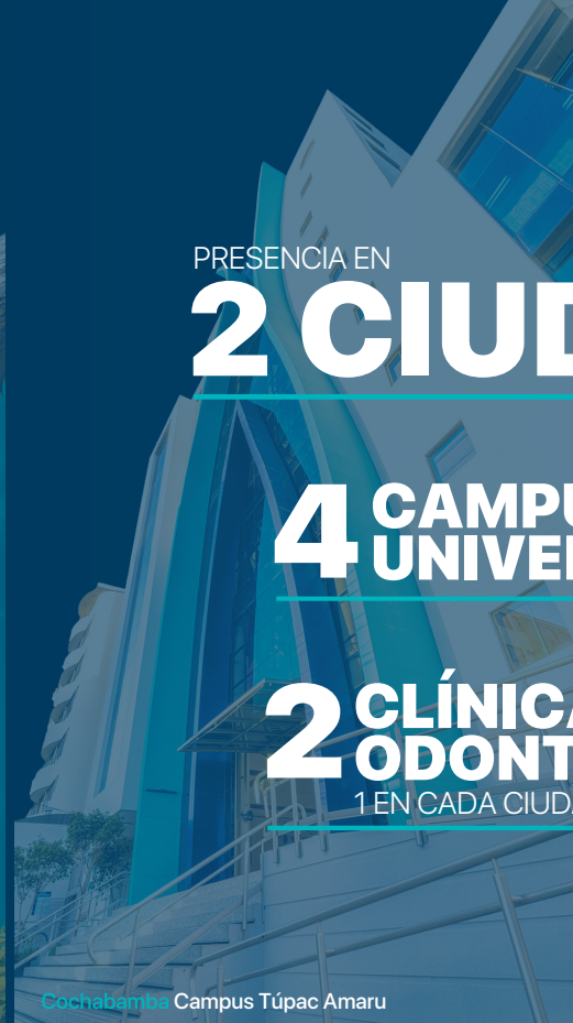
Cochabamba Campus Túpac Amaru