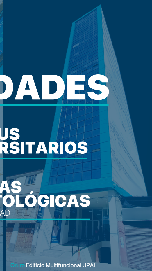
Oruro Edificio Multifuncional UPAL